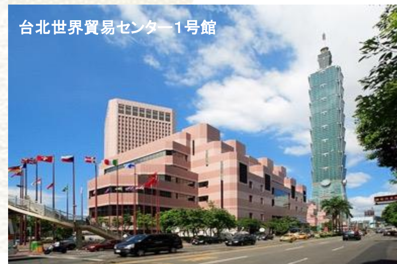
台北世界貿易センター1号館