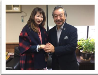
略常務理事兼第5回台湾国際旅游展（TITE）実行委員長（左） 安藤理事長（右）