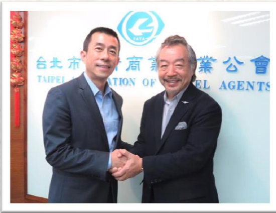
呉理事長（左）安藤理事長（右）